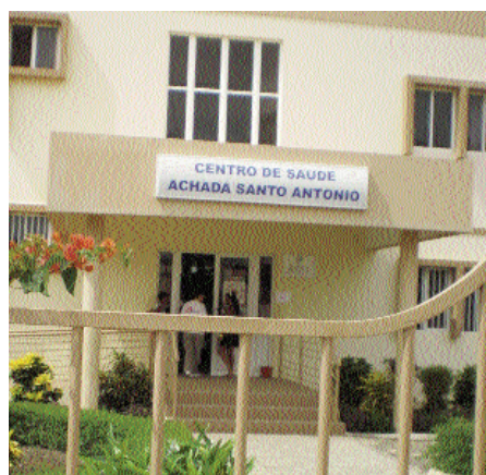
Plusieurs cas suspects de la dengue ont été référés dans les centres de santé du Cap Vert

Selon des données statistiques livrées par l'OMS, à la date du 8 novembre 2009, 12001 cas dont 6 décès ont été notifiés par les autorités sanitaires nationales. Parmi ces cas, 76 ont présenté des signes d'hémorragie. Les îles les plus affectées étaient : Santiago, Fogo, Maio et Brava. Au vu de l'accroissement des cas, le Ministère de la santé du Cap Vert avait lancé un appel international pour accompagner les efforts du gouvernement dans le cadre de la riposte à l'épidémie.