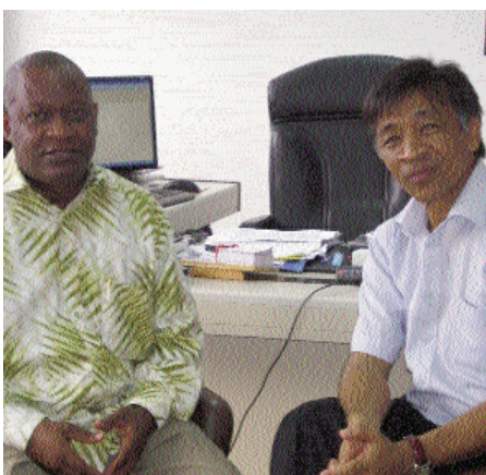
Le Directeur Général de l'OOAS et le Représentant de l'OMS au Cap Vert